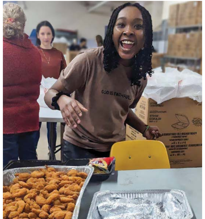
Los Adultos Jóvenes ayudamos en la despensa y albergue para los sin hogar de la Misión de Misericordia de San Lucas y también nos divertimos al hacerlo

y solo posible a través de Dios y los maravillosos Misioneros Oblatos.