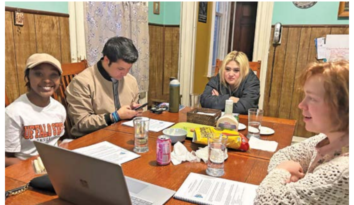
Una vez al mes nos reunimos para estudiar la Biblia y para nuestra junta mensual de organización

En el grupo de Adultos Jóvenes tenemos varios eventos: el Primer Viernes de mes organizamos la Adoración del Santísimo Sacramento, a la que asisten muchos miembros de nuestra comunidad.